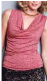
cardinal ctp. 14