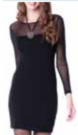
black ctp. 19