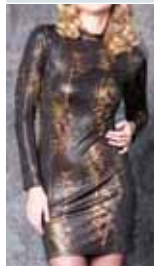
gold python ctp.28, 29