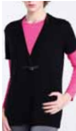
black ctp. 59