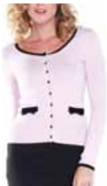
lotus ctp. 6