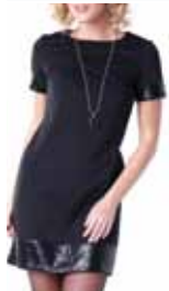
black ctp. 21