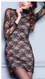
black/beige ctp. 30, 31