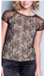
black/beige ctp. 32, 33