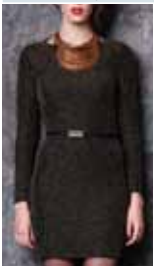
black/gold ctp. 26, 27