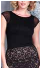
black ctp. 24, 25