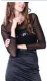
black ctp. 22