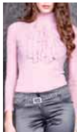
rose mist ctp. 15