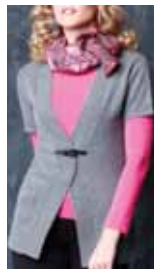
grey melange ctp. 10